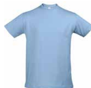
T-shirt ENFANT // 22€60

Motif en face avant et logo sur la manche