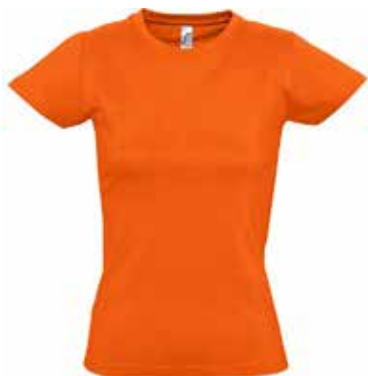
T-shirt FEMME // 24€00

Motif en face avant et logo sur la manche (EN OPTION : FEMME COUPE DROITE)