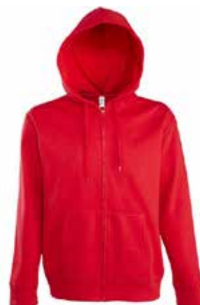
Veste capuche HOMME // 58€ 00