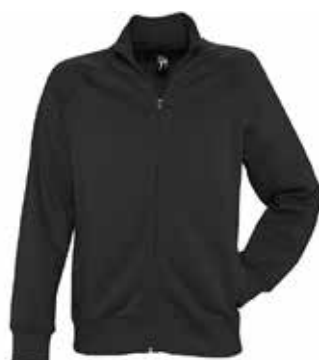
Veste zip HOMME // 58€00