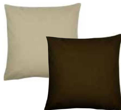
Housse de coussin // 16€00 (30€ les 2)