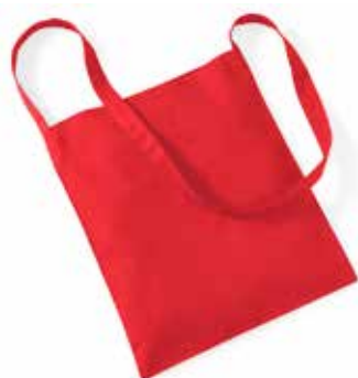
Sac coton // 06€00 Motif au centre