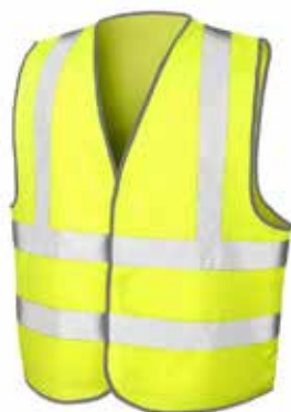
Gilet de sécurité // 19€50 Motif dans le dos et logo à l'avant