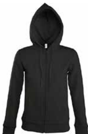
Veste capuche FEMME // 58€00