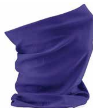
Tour de cou multifonction // 12€90 (avec motif compatible)