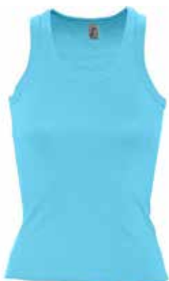
Débardeur FEMME // 24 €00

OPTION MOTIF DANS LE DOS : logo en cœur : + 1,00 € ou rapel dessin en cœur : + 3,00 €