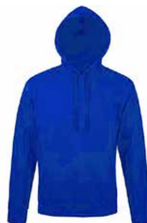
Sweat // 40€00

Motif en face avant et logo sur la capuche