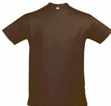
T-shirt HOMME // 24€00

Motif en face avant et logo sur la manche (EN OPTION : FEMME COUPE DROITE)