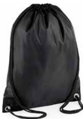
Sac sport // 12€00 Motif au centre