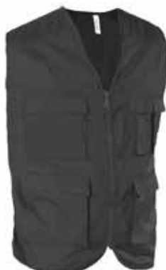
Gilet à poche