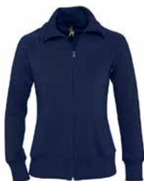
Veste zip FEMME // 58€00